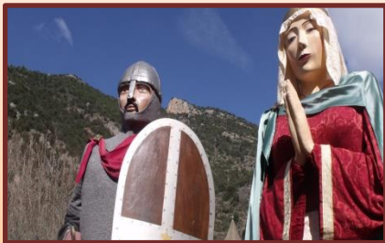
Les géants de Villefranche-de-Conflent

Ce « Plus beau village de France », étape incontournable en pays catalan, est le point de départ de la ligne du Train Jaune, qui dessert Latour-de-Carol, en faisant halte à Mont-Louis, à travers les majestueux paysages du Haut-Conflent, du Capcir et de Cerdagne.