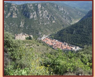
La cité de Villefranche-de-Conflent

Le fort Libéria fait régulièrement l'objet de travaux de restauration pour retrouver sa splendeur d'antan et propose un riche programme d'expositions.