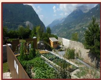
Visite du jardin historique

Toute l'année, la place est animée par de nombreux artisans qui n'hésitent pas à partager leurs savoir-faire. Dans la caserne Campana, une chambrée de soldat a été reconstituée permettant une véritable immersion au cœur de la vie d'une garnison au XVIII e siècle.